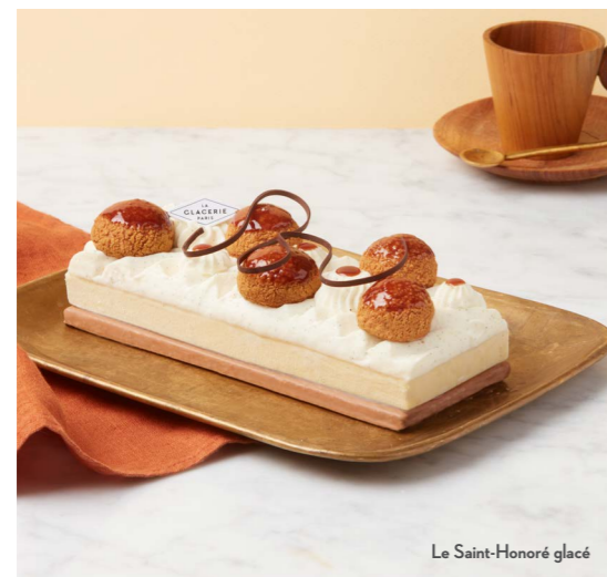
Le Saint-Honoré glacé

* Disponible à partir du 1 er juillet. Pâtisseries glacées pour 6 personnes à 49€