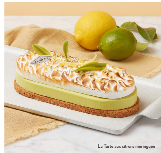
La Tarte aux citrons meringuée