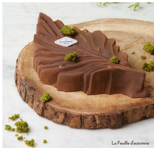
La Feuille d'automne

* Disponible à partir du 1 er novembre. Pâtisseries glacées pour 6 personnes à 49€