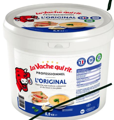
Seau L'Original 5,5kg