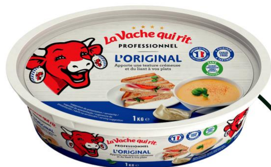
Terrine L'Original 1kg

Inspirante depuis l'origine La Vache qui rit® est plébiscitée par les Chefs pour la pluralité de ses usages : soupes, purée, gratins, tartines, sandwiches... et par les clients pour l'onctuosité et le goût incomparable qu'elle invite dans de nombreuses recettes créatives.