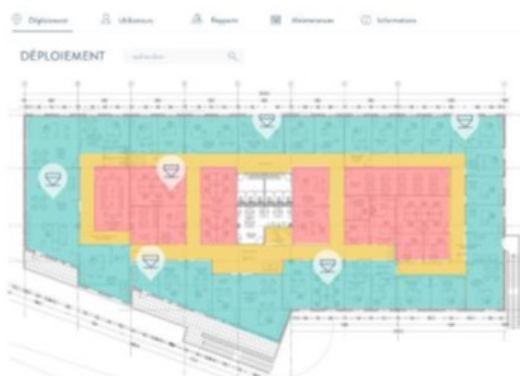
Cartographie des zones à risque de l'évaluation DEKRA Diag'Air

S'appuyant sur ces recommandations, DEKRA met en place l'évaluation DEKRA Diag'Air, un protocole en trois temps à destination des ERP :