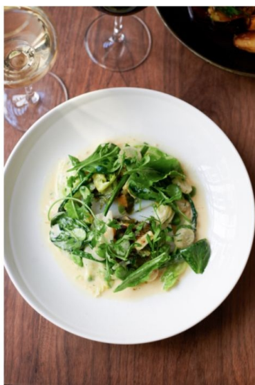
Merlan de ligne - condiment citron meyer - beurre haddock - yuzu kosho