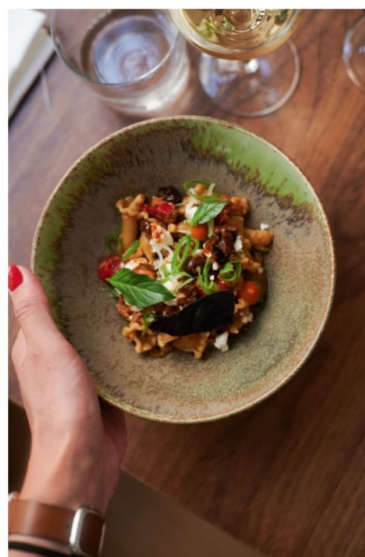
Girolettes - condiment olives taggiasche - tomates confites - harissa

Un sujet sur les huiles, les vinaigres, les pâtes fermentées ou les épices du bout du monde ? Contactez-nous pour avoir le témoignage d'un expert.