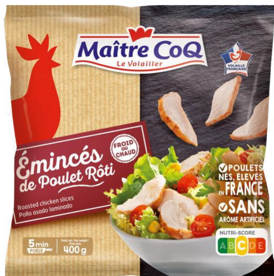
Émincés de Poulet Rôti Sachet 400g - DDM 12 mois

Idéal pour une cuisine express et facile à préparer, à déguster chaud ou froid, à la maison ou en lunchbox, les Émincés de Poulet Rôti garantissent un repas gourmand et savoureux pour le quotidien des consommateurs. Son format de 400 grammes est parfait pour préparer tous les repas du quotidien tels que les salades composées, plats chauds, quiches et pizzas.