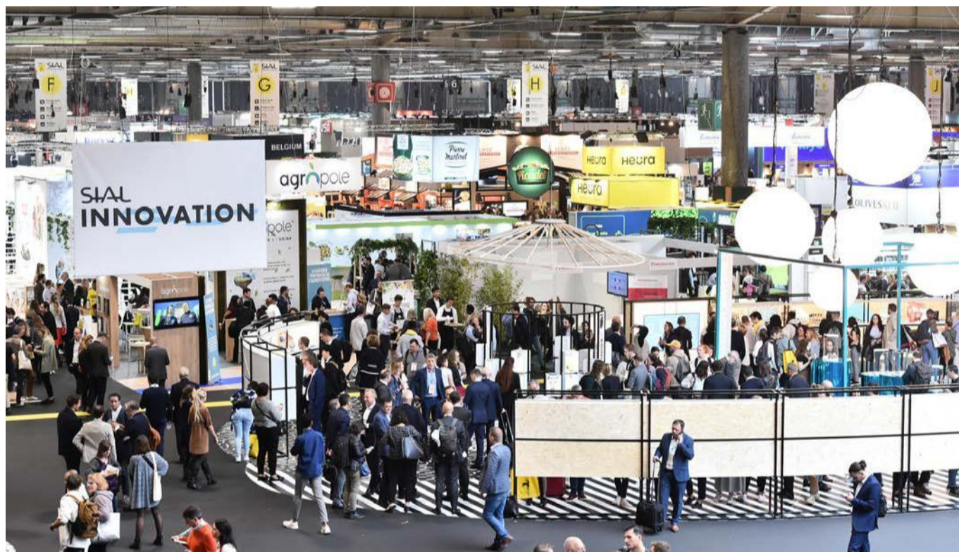
Vue générale salon SIAL Paris 2022

SIAL Paris vient de fermer ses portes. Le bilan est extrêmement positif : c'est le premier événement mondial de cette envergure qui réussit à retrouver son niveau prépandémie , tant côté exposants que visiteurs. En effet, le salon a réuni plus de 7 000 exposants de 127 pays (90% internationaux) avec une fréquentation quasiment équivalente à l'édition 2018 soit 265 000 professionnels et une proportion de visiteurs internationaux encore plus spectaculaire (85%) dont 50% d'importateurs/exportateurs et 8 000 top acheteurs pesant à eux seuls un portefeuille d'achat de plus de 50 milliards d'euros. Le salon a tenu toutes ses promesses de reconnexion des acteurs du secteur et renforce son positionnement de rendez-vous business incontournable du secteur agroalimentaire mondial .