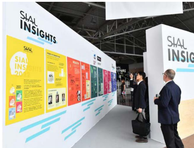
Restitution de SIAL Insights sur les tendances qui agitent la planète food

Venue repérer avec son équipe des produits à la fois pour le grand public et pour les chefs, elle a dès le premier jour signé des accords avec 8 nouveaux fournisseurs notamment dans l'épicerie fine. Ce n'est ni son premier SIAL ni son dernier car elle compte bien revenir en 2024 avec une équipe encore plus nombreuse.