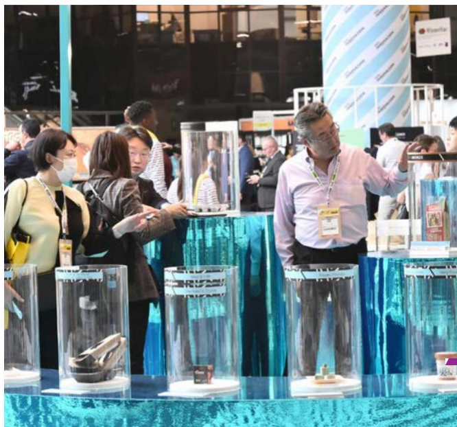
Produits lauréats exposés sur l'espace SIAL Innovation 2022

Le SIAL ne pouvait avoir meilleure thématique que celle d'« OWN THE CHANGE », mettant en avant ce que tous les maillons de la chaîne mettent en place avec engagement pour innover, produire, distribuer, consommer de manière plus vertueuse. Une manière pour le SIAL de rendre compte des scénarios du futur pour les aider à anticiper ce que sera demain tant au niveau des nouveaux ingrédients que des technologies et des attentes des consommateurs, en termes de santé, d'authenticité, de transparence et de bien manger.