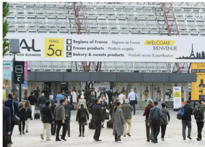
SIAL Paris 2022 vue extérieure

Audrey Ashworth , Directrice de SIAL Paris