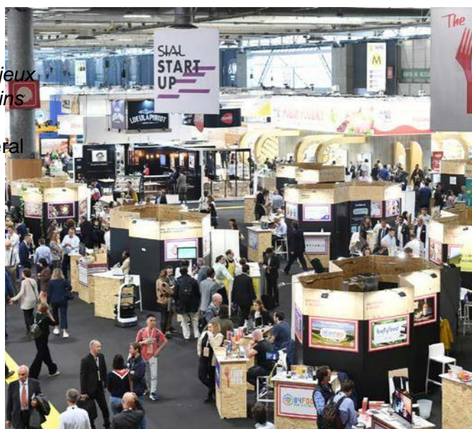
Village Start-up SIAL Paris 2022

Pendant 5 jours se sont succédées 120 visites officielles internationales, dont 3 ministres de la République française*, preuve que l'alimentation et la gastronomie sont des leviers de plus en plus importants de la communication des pays et plus généralement de leur diplomatie.