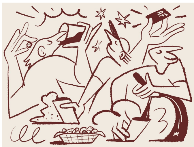
Élément de la nouvelle identité visuelle.

Le bar s'impose plus qu'avant avec un fond orange lumineux. Les tireuses pression en libre-service et les marques sont mieux valorisées. Les pictogrammes de la nouvelle identité s'invitent sur les murs, participant au cadre moderne et convivial.