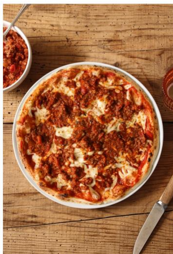
Les pasta Pomodoro