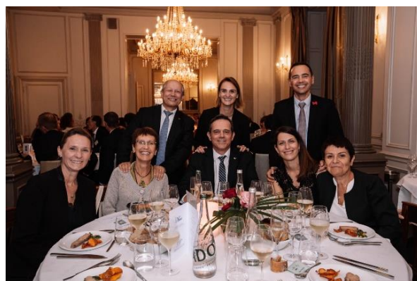
Les professeurs des étudiants au Château des Reynats à Chancelade