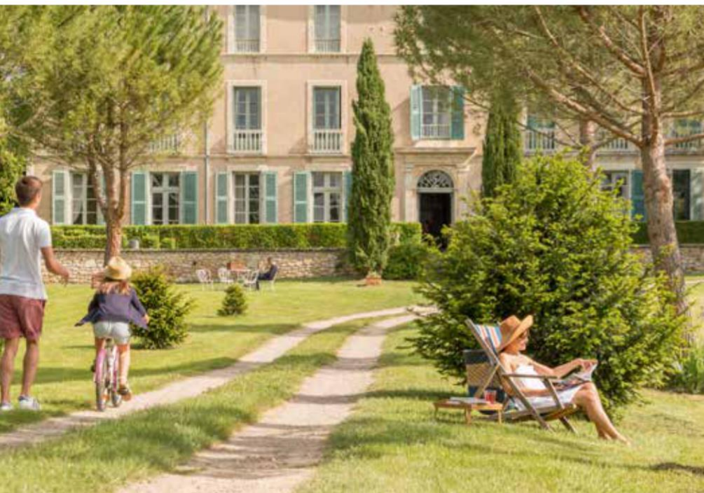
Domaine de La Monestarié