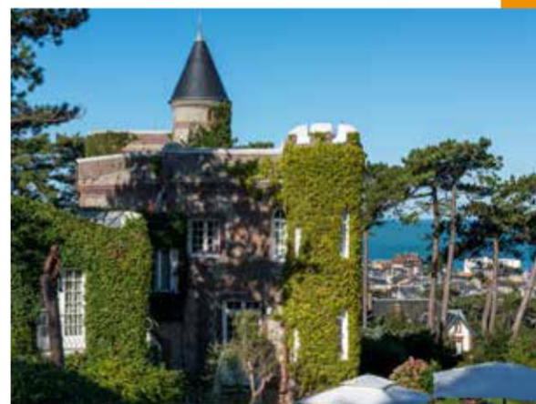
Le Donjon - Domaine Saint Clair