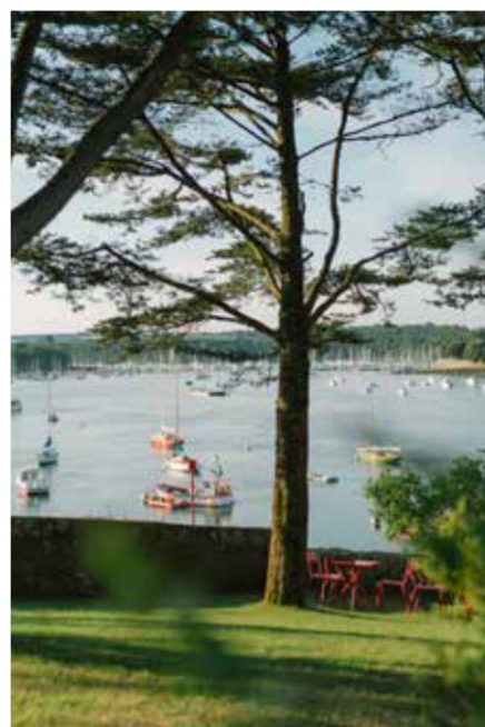
Villa Tri Men

C'est un esprit résolument communautaire qui souffle au sein des Collectionneurs, et à l'image de ceux qui l'animent, la communauté évolue, s'enrichit chaque année, grâce aux comités restaurateurs, hôteliers et voyageurs. C'est en choisissant d'inclure les voyageurs dans leur travail de réflexion et de développement, que les Collectionneurs signent toute la modernité d'un collectif qui ne se contente pas d'être une sélection d'adresses au cahier des charges statutaire. Outre plusieurs rendez-vous annuels pour les membres du Comité Voyageurs, chaque hôte est par ailleurs invité à partager sur les différents supports ses souvenirs de séjour, ses découvertes et même ses propositions de nouvelles adresses. À l'inverse, ils y trouvent des portraits de chefs, des recommandations d'hôteliers, de voyageurs... À l'ère du digital et de la convivialité des échanges qui caractérisent l'ambiance de leurs maisons, les Collectionneurs privilégient un dialogue spontané, et tissent un lien fort avec la communauté.