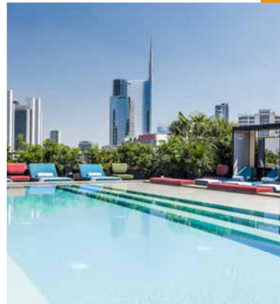
Ceresio 7 Pools & Restaurant

Ceresio 7 Pools & Restaurant. C'est l'un des rooftops les plus prisés de la ville et depuis la salle de restaurant, la vue sur la skyline milanaise est à couper le souffle. La cuisine du Chef Elio Sironi a trouvé un cadre à sa mesure. Une référence aussi parmi les bars à cocktails.