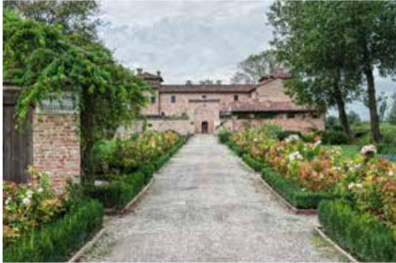
Antica Corte Pallavicina