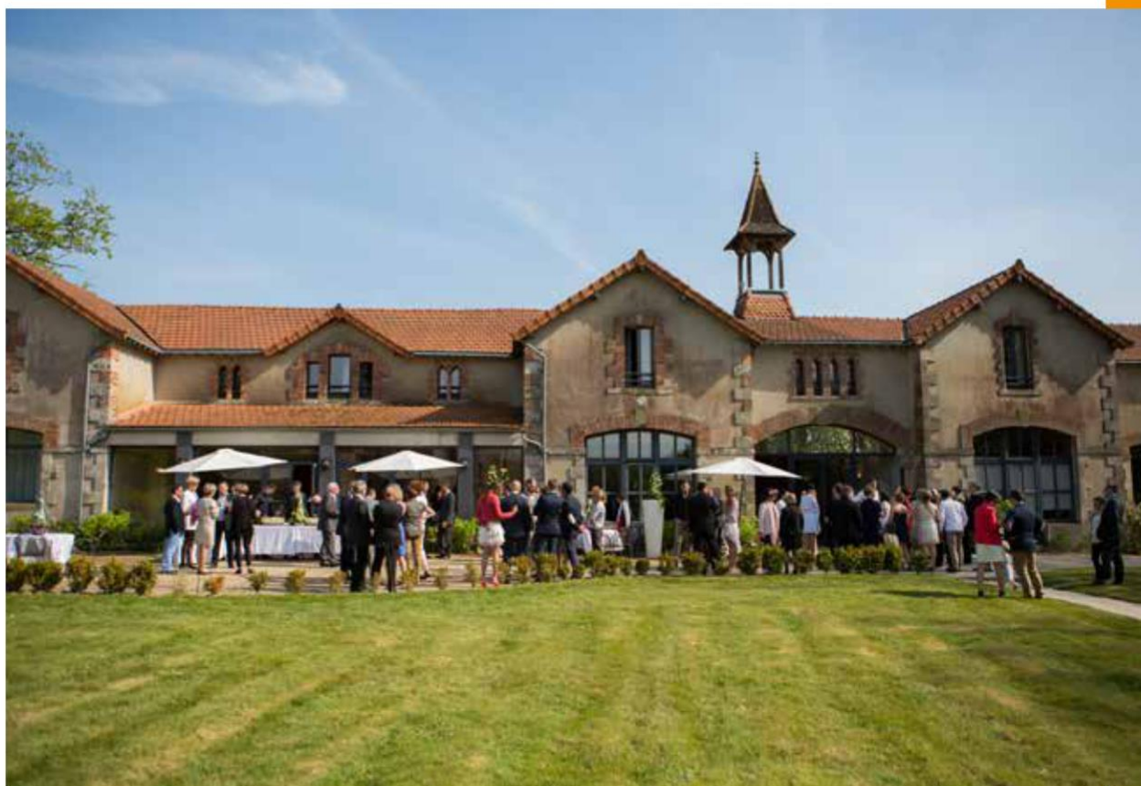
de Brandois | © Simon Boursier