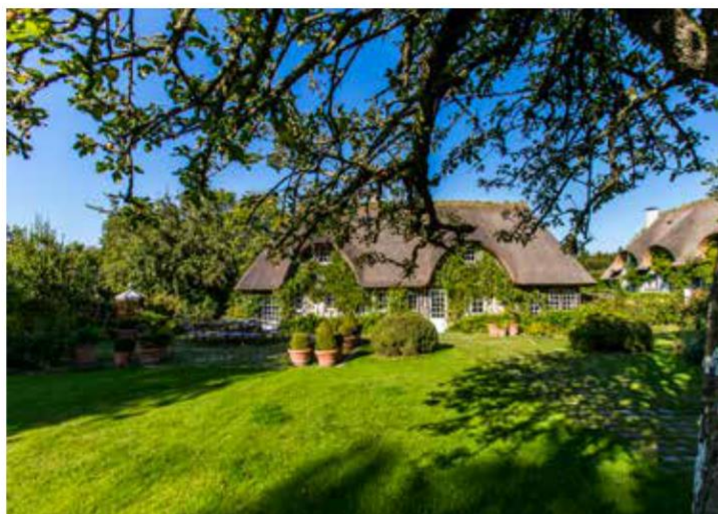
Domaine d' Ablon