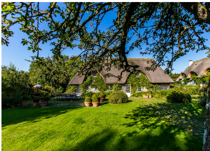
Domaine d'Ablon