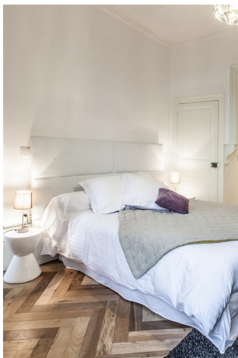
Le Manoir de la Manantie