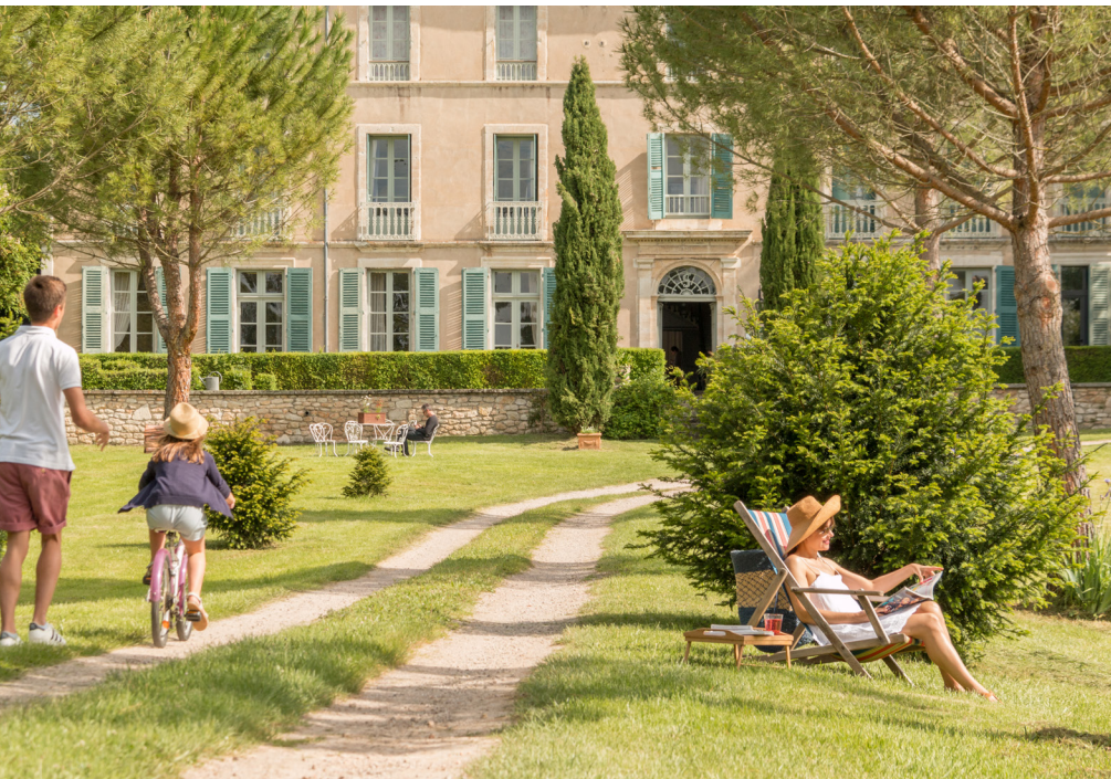
Domaine de La Monestarié