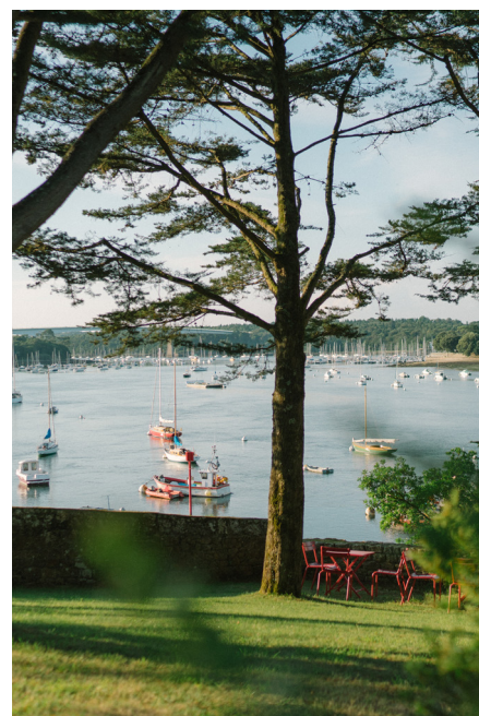
Villa Tri Men

C'est un esprit résolument communautaire qui souffle au sein des Collectionneurs, et à l'image de ceux qui l'animent, la communauté évolue, s'enrichit chaque année, grâce aux comités restaurateurs, hôteliers et voyageurs. C'est en choisissant d'inclure les voyageurs dans leur travail de réflexion et de développement, que les Collectionneurs signent toute la modernité d'un collectif qui ne se contente pas d'être une sélection d'adresses au cahier des charges statutaire. Outre plusieurs rendez-vous annuels pour les membres du Comité Voyageurs, chaque hôte est par ailleurs invité à partager sur les différents supports ses souvenirs de séjour, ses découvertes et même ses propositions de nouvelles adresses. À l'inverse, ils y trouvent des portraits de chefs, des recommandations d'hôteliers, de voyageurs... À l'ère du digital et de la convivialité des échanges qui caractérisent l'ambiance de leurs maisons, les Collectionneurs privilégient un dialogue spontané, et tissent un lien fort avec la communauté.