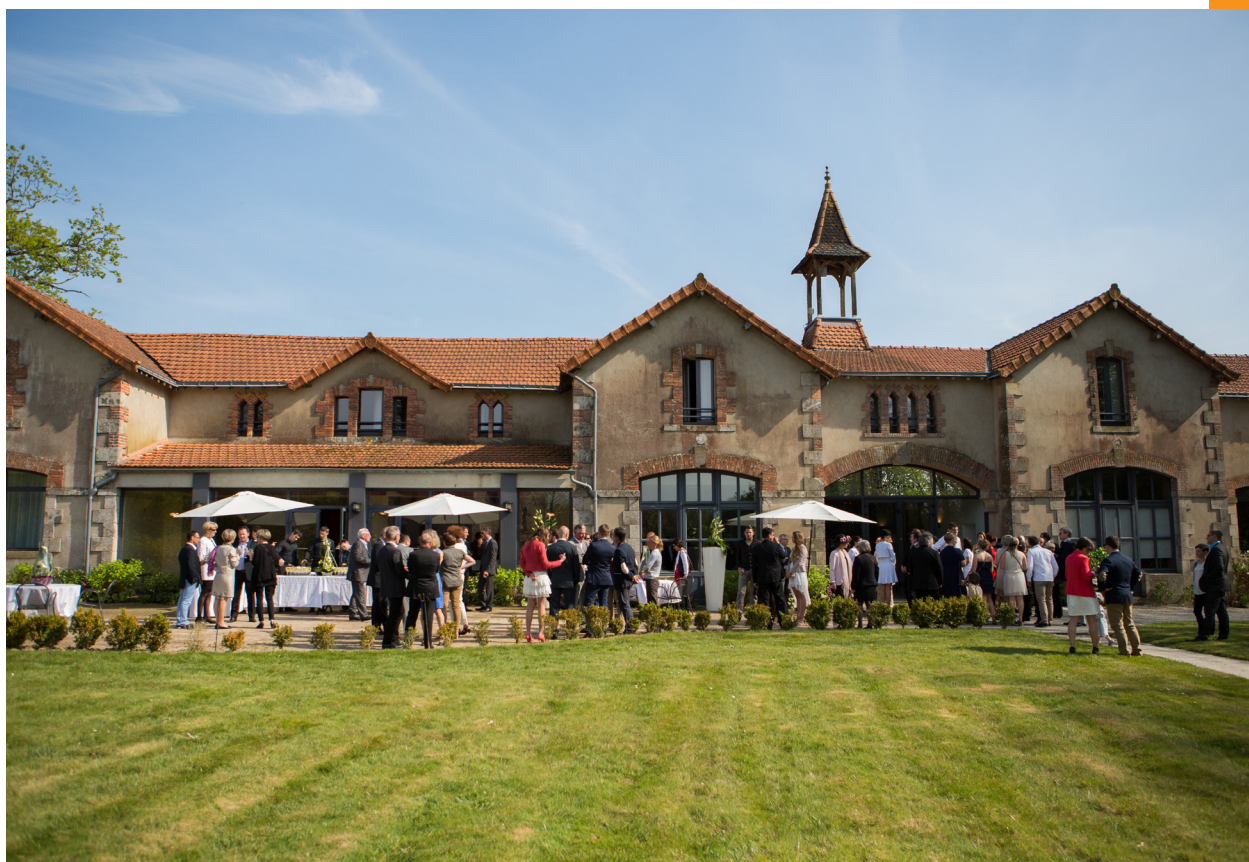
Domaine de Brandois