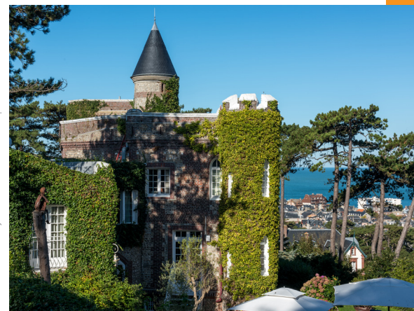
Le Donjon - Domaine Saint Clair