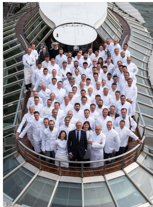
Déjeuner des Chefs 2019