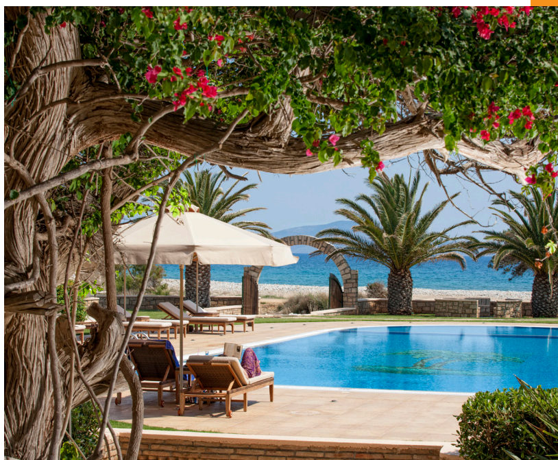
Finikas Luxury Hotel