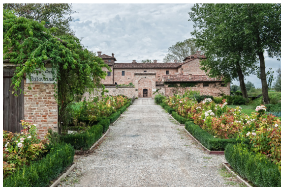
Antica Corte Pallavicina