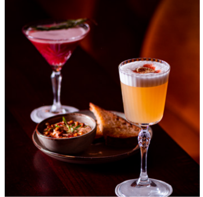
Derrière le bar, les mixologistes secouent des potions créatives dont des pépites signatures telles que Le Rosemary (Gin infusé au thym, jus de poire, citron vert, sirop d'hibiscus).