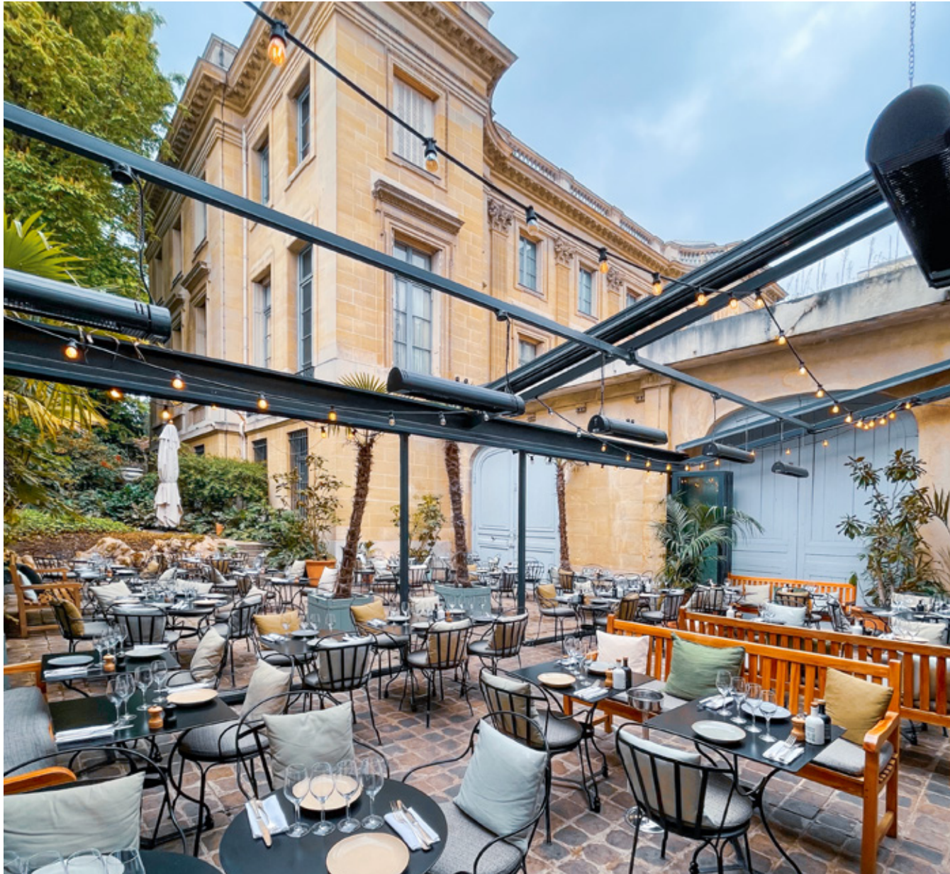
Sous la verrière ouverte aux beaux jours avec tables nappées ou depuis la cour pavée au milieu des arbres, la terrasse du Camondo fait figure de havre de paix hautement instagrammable à l'abri des voitures.