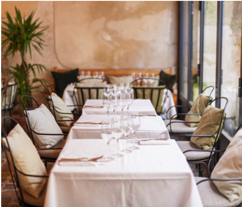
Canapés 70's, boiseries, plantes luxuriantes, bar lumineux en céramique... Le décor, pensé comme une oasis exotique en plein Paris, est signé par l'agence Favorite.

Bien que remis au goût du jour grâce à un décor easy-chic, pénétrer dans les murs du Camondo relève presque de la visite historique. Le restaurant, qui a gardé sa structure classée, se tient en lieu et place des anciennes écuries puis de l'ancienne remise aux voitures de l'hôtel particulier. Inspiré du Petit Trianon de Versailles, celui-ci a été édifié en 1911 à la demande de Moïse de Camondo, banquier et collectionneur compulsif, pour y présenter ses incroyables pièces d'art décoratif du XVIIIe siècle.