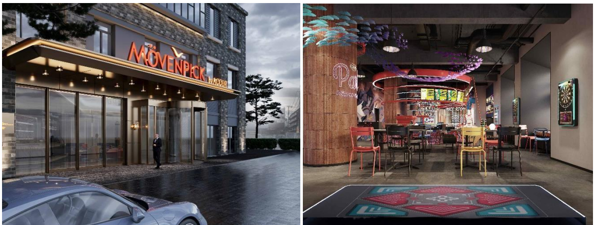
Le Mövenpick by Accor Nanjing, ouvert en mai 2024 (à gauche) JO&JOE ouvrira plusieurs adresses en Chine en 2024 (à droite)

Depuis près de 40 ans, Accor développe un solide réseau, fondé sur des relations de confiance et des partenariats étroits avec les principaux acteurs de l'hôtellerie chinoise. Les accords de franchise conclus avec ces partenaires ont été la clé de la croissance exponentielle du Groupe dans la région. Dans ce cadre, les partenaires, encouragés à maximiser le volume d'ouvertures, se voient accorder les droits exclusifs d'exploiter des hôtels sous les marques haut de gamme, milieu de gamme ou économiques de Accor, tout en mobilisant leurs réseaux et leur influence locale pour développer rapidement ces établissements. Le Groupe apporte pour sa part son expertise internationale et la réputation de ses marques, tout en développant, à chaque nouveau projet, ses propres relations et en identifiant de nouvelles opportunités de développement.