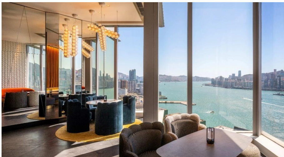
Le Mondrian Hong Kong