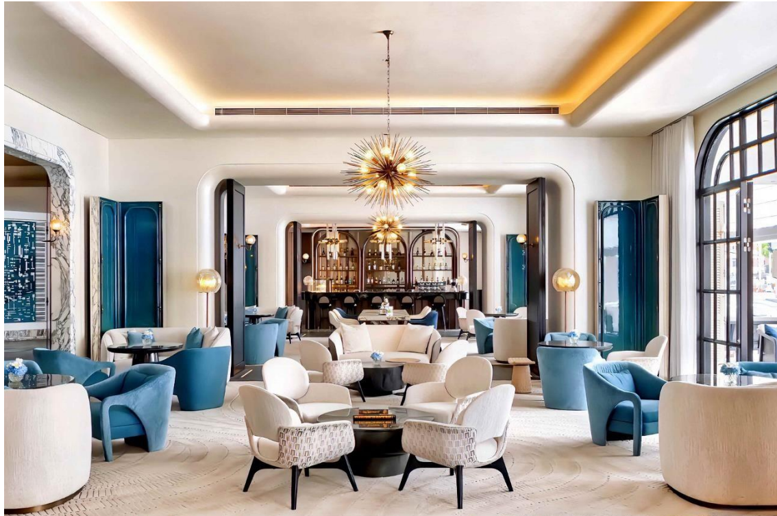
L'Orchestre, salon du hall d'entrée du Sofitel Shanghai North Bund

français contemporain à travers le monde. 2024, désignée « Année de la culture et du tourisme entre la Chine et la France », sera en outre l'occasion de célébrer 60 ans de relations diplomatiques entre ces deux pays. Les destinations Sofitel en Grande Chine, dont le nouveau Sofitel Shanghai North Bund , vont ainsi vivre au rythme d'une année jalonnée de célébrations et de festivités franco-chinoises.