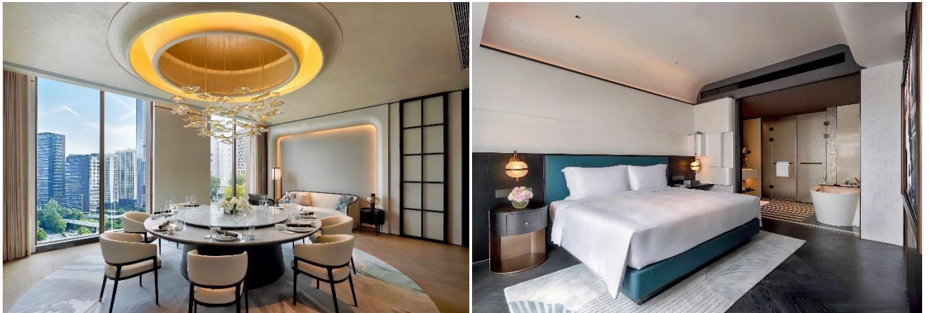
Restaurant chinois Hui (à gauche) et chambre de luxe (à droite) au Sofitel Shanghai North Bund