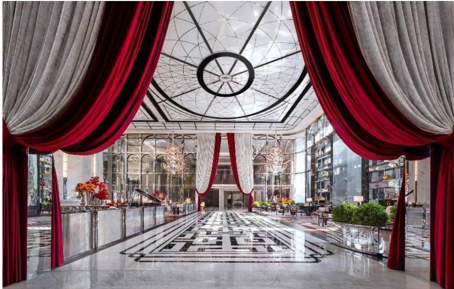
Le Raffles at Galaxy Macau

En 2025, Accor plantera deux nouvelles enseignes en Grande Chine. Adagio ouvrira ainsi sa première résidence avec services au cœur du marché animé de Chengdu, alors que le TRIBE NATION Guiyang South fera découvrir une expérience hôtelière urbaine inédite aux voyageurs chinois modernes ou issus de la génération Z.