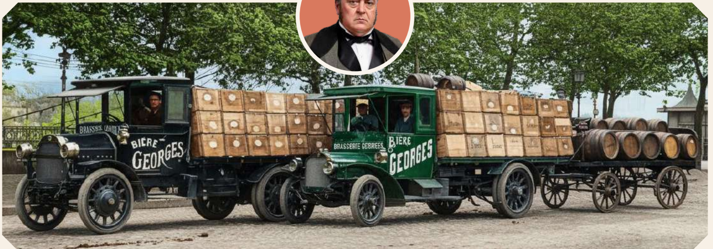
PHOTOGRAPHIE D'ÉPOQUE RECOLORISÉE VERSION 2026

Nouvelle identité, nouveaux produits, évolutions des process et de l'outil de production : la Fabrique du Faubourg engage un virage stratégique pour imposer Bières Georges comme la référence régionale en Auvergne Rhône-Alpes.