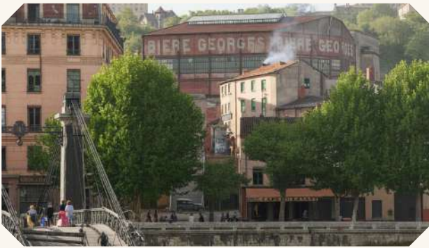
PHOTOGRAPHIE D'ÉPOQUE RECOLORISÉE VERSION 2026

BIÈRES GEORGES, c'est d'abord une histoire de brasseurs. Celle d'un Alsacien obstiné qui ouvre sa brasserie au 28-30 cours du Midi, à Perrache, avec une façade de 42 mètres et des fûts de bière stockés au-dessus du bar. 3 000 hectolitres vendus dès 1860. L'affaire prospère sous Mathieu Umdenstock , gendre du fondateur, qui étend l'empire Georges à travers Lyon avec trois établissements : Brasserie du Parc , de l'Alhambra et Thomassin . Il installera dans la Montée de Choulans , une usine équipée de