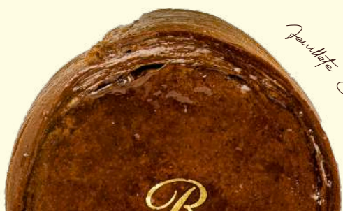
Flan Feuilleté Chocolat