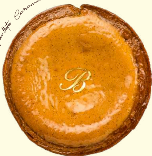
Flan Feuilleté Caramel