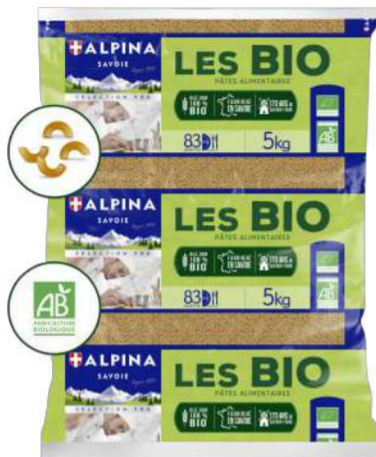
Coquillettes bio semi-complètes (format 5 kg)