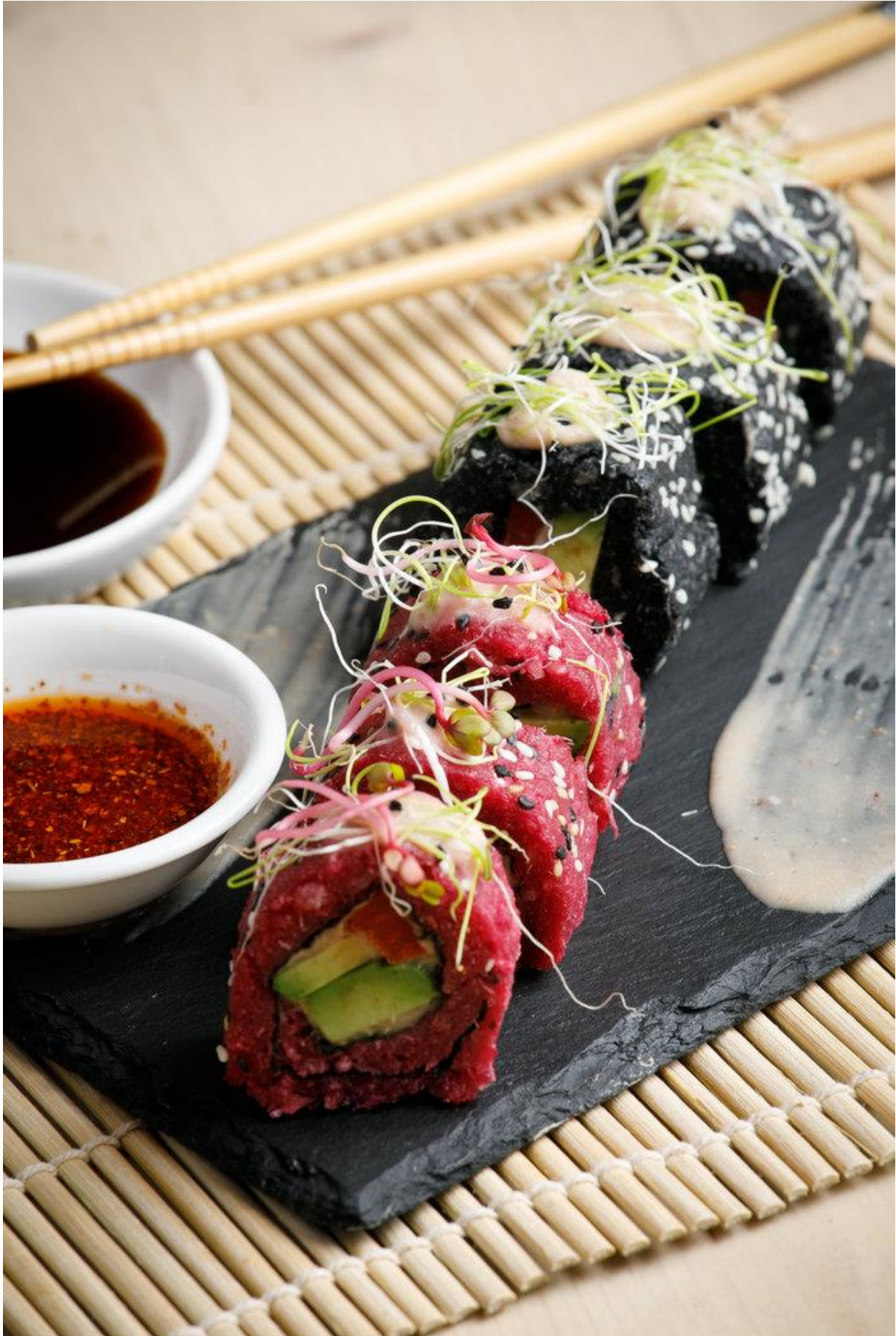
Avec l'arrivé du printemps Aurore change son menu et lance sa