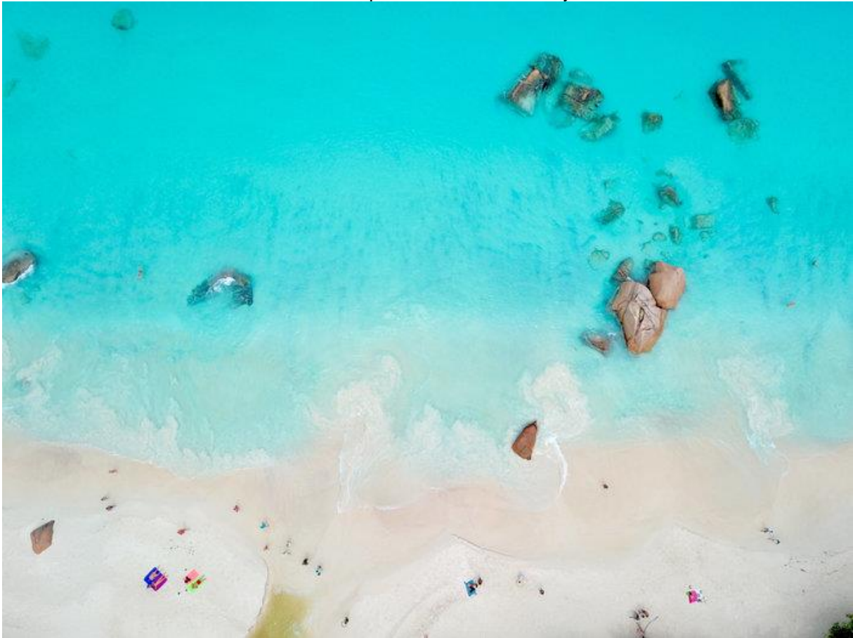
Din GABRIEL des Seychelles